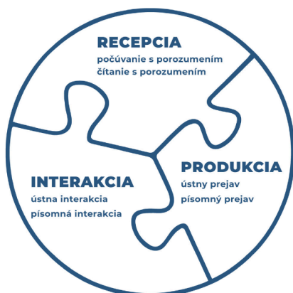
Obrázok č. 1 Komponent vzdelávacej podoblasti JaK, SJ a CJ